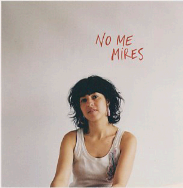
Fer Laguna 2008 fotografía, 80 x 80 cm