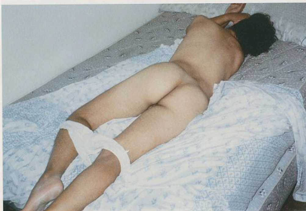
FOTO MISTERIOSA Y UNA EN LA QUE NO SE ENTIENDE NADA - APENAS UNO SACA UNA FOTO BUENA, EMPIEZA LO MALO - CUANDO TODO FALLE, AGARRARSE DE LA LUZ. LA LUZ ES GARANTÍA DE FOTO "INTERESANTE"